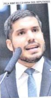
ZECA REBE DO/CÂMARA DOS DEPUTADOS