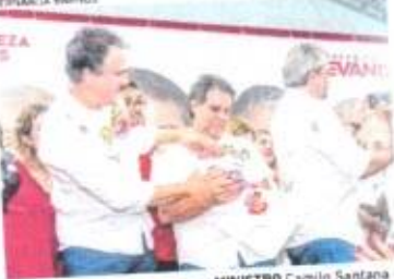
MINISTRO Camilo Santana e Evandro Leitão